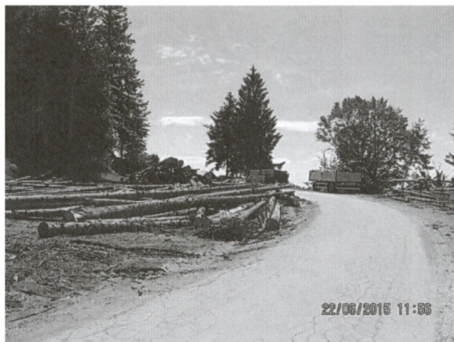
Slika 1: Izvajanje del v varovalnem pasu občinske ceste

Na območju Občine Zreče so občinski redarji in inšpektorica v letu 2015 izvajali naslednje ukrepe, ki so razvidni iz spodnje tabele: