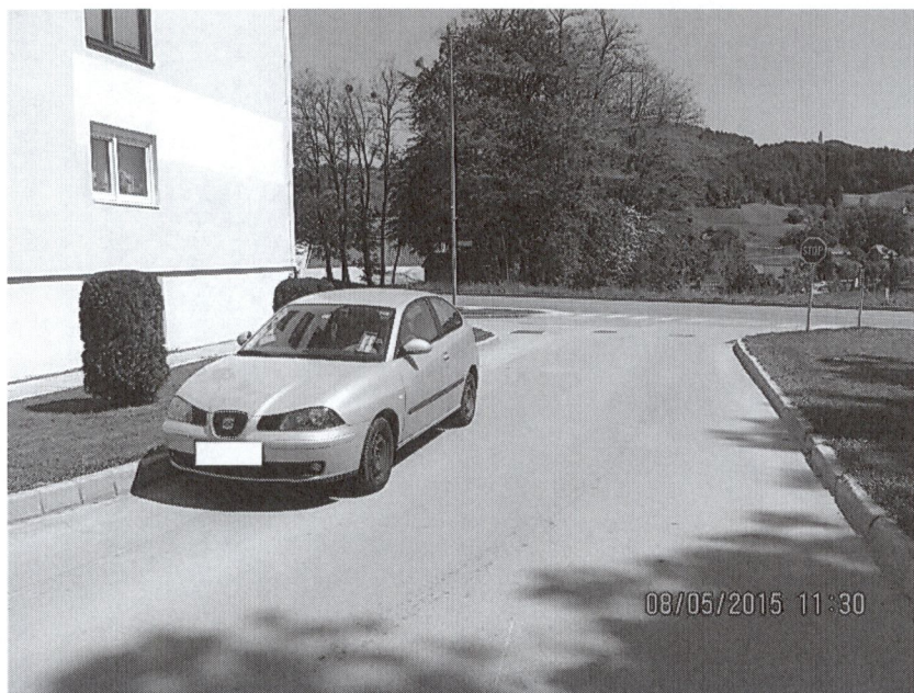
Slika 2: Nepravilno parkirano vozilo