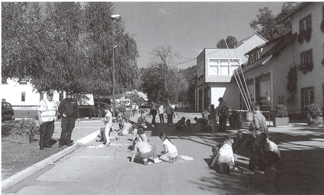
Učenci OŠ Zreče rišejo s kredami po javnih površinah različna prevozna sredstva (Utrinek iz Evropskega tedna mobilnosti 2015)